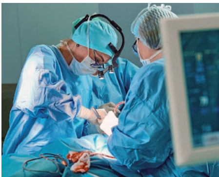
Dans 60% des cas, les infections sont d'origine bactérienne.

Plus de la moitié des patients ayant bénéficié d'une transplantation d'organe développent dans l'année qui suit des infections sévères dues aux médicaments immunosuppresseurs