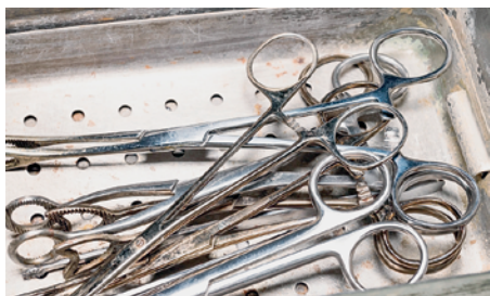
Edelstahlinstrumente als Wegwerfware. (Symbolbild © Konstantin Kolidzei | Dreamstime.com)

Einweg statt Mehrweg: Tausende Instrumente aus Edelstahl wie Scheren und Pinzetten werden täglich in Arztpraxen und Kliniken wegwerfen. Das ist billiger, als sie zu sterilisieren.