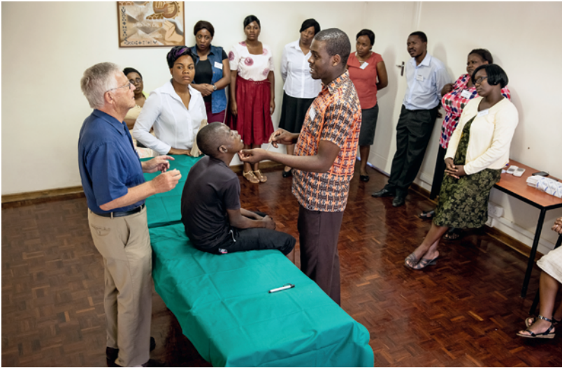
Die Newlands Clinic bildet jährlich bis zu 800 Medizinerinnen, Mediziner und Pflegenden in der HIV-Behandlung aus und möchte diese Rolle noch verstärken.