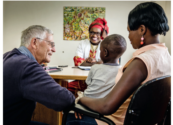
Die Newlands Clinic betreut rund 7000 Patientinnen und Patienten – und bietet ihnen eine umfassende Behandlung.

Dank Spendengeldern konnten wir die Klinik ausbauen. Gleichzeitig gelang es uns, die Effizienz zu steigern. Gut behandelt, ist HIV heute eine chronische Krankheit. Viele Patienten kommen seit vielen Jahren zu uns, ihre Gesundheit ist stabil. Ganz wichtig: Wir haben sehr gute Resultate, was die Therapietreue angeht. Unsere langjährigen Patienten brauchen nicht mehr viel Betreuung. Dies ermöglicht uns, neue Patienten aufzunehmen, ohne dass wir mehr Personal brauchen. Die hohe Therapietreue erspart uns auch, die wesentlich teureren Medikamente für eine Zweit- oder Drittlinientherapie einzusetzen.