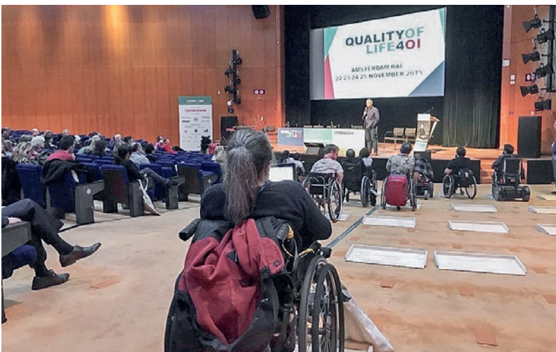
Der Konferenzsaal war mit provisorischen baulichen Massnahmen für Rollstuhlfahrende besonders bequem eingerichtet worden.