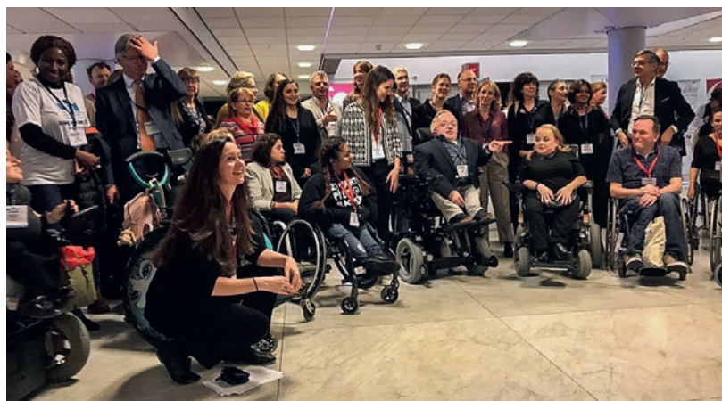
Unter den 300 Teilnehmenden befand sich eine ansehnliche Anzahl Osteogenesis-imperfecta-Betroffene jeglichen Alters und verschiedenster Ausprägungen des Bindegewebe-Defekts.

Weitere Informationen zu Osteogenesis imperfecta finden sich unter www.glasknochen.ch