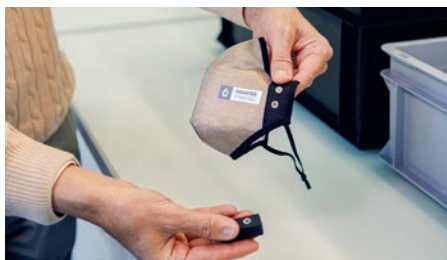
Die Maske besteht aus einem mehrlagigen Textil, Elektroden und einer kleinen Batterie © ZHAW, Hannes Heinzer.