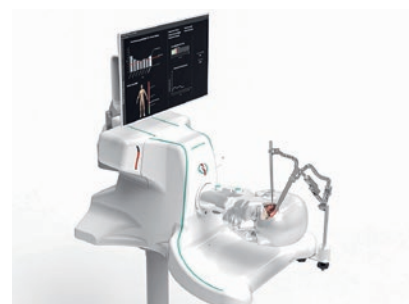
Am 4D-Simulator mit patientenspezifischem Kopfmodell können komplexe Hirnaneurysma-OPs trainiert werden © SurgeonsLab.