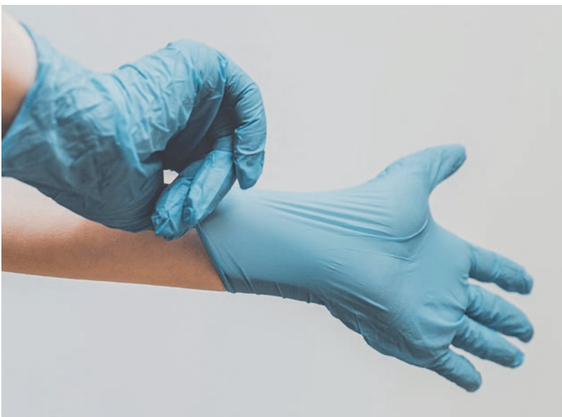
Les femmes médecins: engagées, mais trop peu souvent promues.

Promotion sur la base de l'expertise: les promotions se font généralement sur la base des connaissances et des capacités, c'est-à-dire de l'expertise professionnelle. Les compétences en matière de leadership jouent souvent un rôle secondaire, ce qui s'avère problématique. De nombreuses femmes hautement qualifiées remplissent toutes les conditions requises pour occuper un