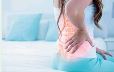
Neue Chancen für Schmerzbehandlung.

In der Schmerzklinik Basel wurde die weltweit erste Implantation einer SCS-DTM (spinal cord stimulation Differential Target Multiplexed™ ) vorgenommen. Die unter chronischen Schmerzen leidende Patientin verspürte nach dem Einsetzen des SCS-DTM eine Schmerzreduktion von mehr als 50%. Die klinische Wirksamkeit der Rückenmarkstimulation (SCS) ist schon seit langem nachgewiesen. Neuartig sind in diesem Bereich nun die 2020 entwickelten Wellenformen namens Differential Target Multiplexed™ . Diese bieten wertvolle Behandlungsoptionen für Patientinnen und Patienten mit chronischen Schmerzen.