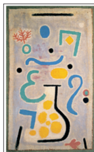
Paul Klee DIE VASE 1938 Blattformat: 60 x 80 cm CHF 140.–