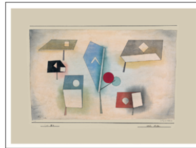
Paul Klee SECHS ARTEN 1930 Blattformat: 67 x 49 cm CHF 125.–