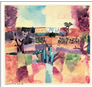
Paul Klee HAMMAMET 1914 Blattformat: 42,5 x 34 cm CHF 99.–