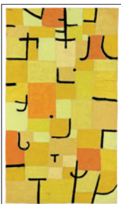
Paul Klee ZEICHEN IN GELB 1937 Blattformat: 60 x 80 cm CHF 140.–