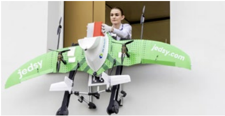
Le drone s'arrime à la fenêtre du laboratoire.