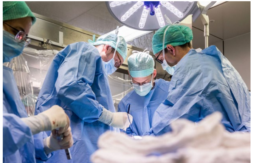
Équipe chirurgicale de l'USZ en salle d'opération

Formation continue Sur la plateforme en ligne «Global School of Surgery», un public international pourra accéder gratuitement au curriculum chirurgical à partir de 2023. Sur sa chaîne Youtube, l'Hôpital universitaire de Zurich (USZ) met déjà à disposition 120 vidéos couvrant l'ensemble du domaine de la chirurgie générale et de transplantation. Celles-ci servent à la formation chirurgicale locale initiale et continue et ont été vues par plus de 600 000 personnes à ce jour. Les réactions à l'offre de e-learning ont été très positives. Dans un sondage publié dans la revue Annals of Surgery (doi.org/10.1097/sla.0000000000005642), le haut niveau professionnel des confé-