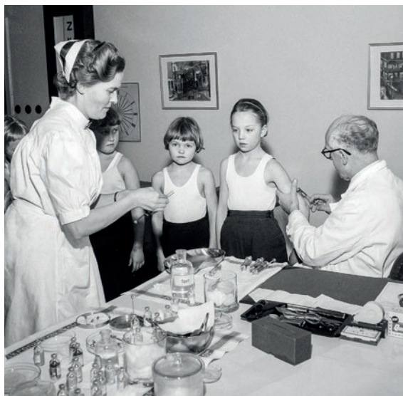
Früher kam es häufig vor, dass die «Frau Doktor» in der Praxis ihres Mannes mithalf.