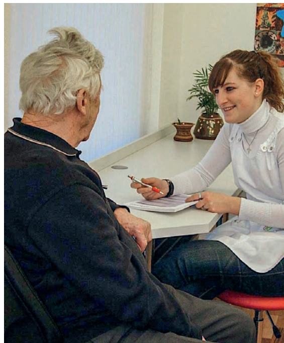
Heute arbeiten neben der MPA auch medizinische Praxiskoordinatorinnen und -koordinatoren in der Hausarztpraxis.

Die Arztpraxis von Dr. Fuchs existiert nicht mehr: Sein Nachfolger hat mit Kollegen zusammen eine Gruppen-