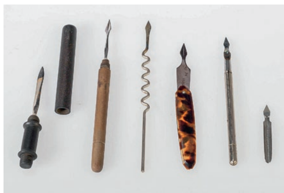
Impfanzetten nach Jenner, o.J., Institut für Medizingeschichte Bern, Inv.-Nr. 3975.

Heutzutage nutzen verschiedene Museen hybride Vermittlungsstrategien. Gewöhnlich begleiten digitale Inhalte jedoch bestehende Ausstellungen. Unser Projekt ist also insofern einzigartig, als es eine eigenständige digitale Ausstellung darstellt. Wir wollen uns allerdings in Zukunft nicht ausschliesslich auf den virtuellen Raum