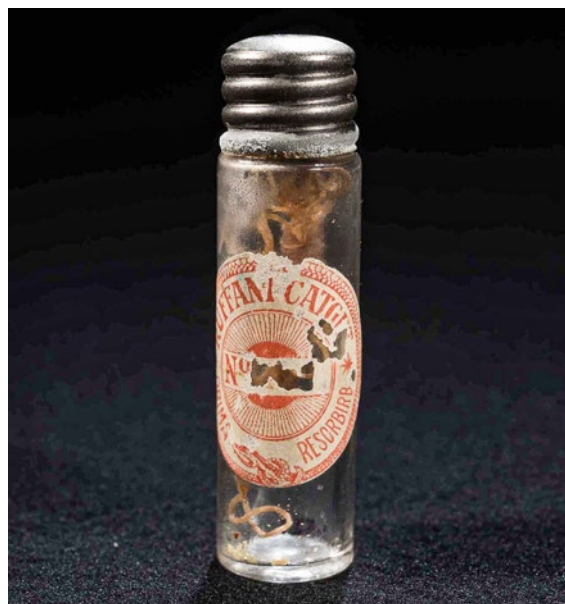
Catgut, um 1950, Institut für Medizingeschichte Bern, Inv.-Nr. 3522.

diese waren aber immer gut und rasch lösbar. Zum Glück konnten wir auf eine ausgezeichnete Zusammenarbeit mit der Web-Agentur zählen, ein junges Team, welches uns flexibel und engagiert zur Seite stand. Vieles ist dadurch auch im Dialog entstanden, sozusagen ein Pingpong-Spiel zwischen Inhaltskonzept und technischer Umsetzung als agiles Projekt. Es war eine intensive Zeit. Bildredaktion, Konzept und Inhalt haben wir intern abgewickelt. Das Team hat diese Aufgaben trotz der zusätzlichen Belastung hervorragend gemeistert.