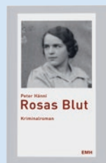
Rosas Blut von Peter Hänni