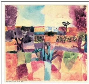
Paul Klee HAMMAMET 1914 Blattformat: 42,5 x 34 cm CHF 99.–