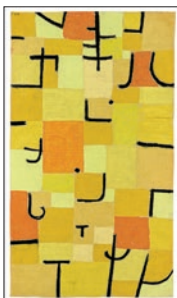
Paul Klee ZEICHEN IN GELB 1937 Blattformat: 60 x 80 cm CHF 140.–