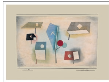
Paul Klee SECHS ARTEN 1930 Blattformat: 67 x 49 cm CHF 125.–