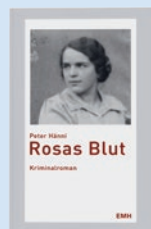
Rosas Blut von Peter Hänni