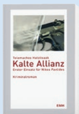
Kalte Allianz von Telemachos Hatziisaak