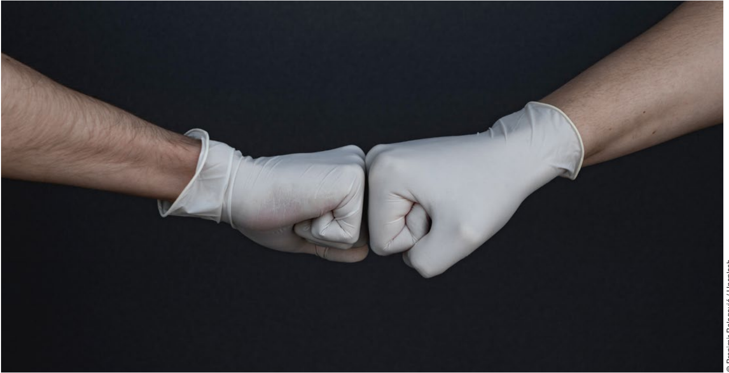
Les scientifiques unissent leurs forces pour étudier le SARS-CoV-2.