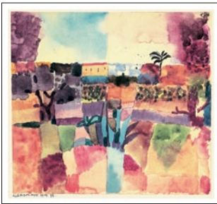
Paul Klee HAMMAMET 1914 Blattformat: 42,5 x 34 cm CHF 99.–