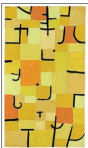
Paul Klee ZEICHEN IN GELB 1937 Blattformat: 60 x 80 cm CHF 140.–