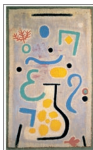
Paul Klee DIE VASE 1938 Blattformat: 60 x 80 cm CHF 140.–