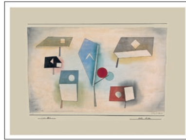
Paul Klee SECHS ARTEN 1930 Blattformat: 67 x 49 cm CHF 125.–