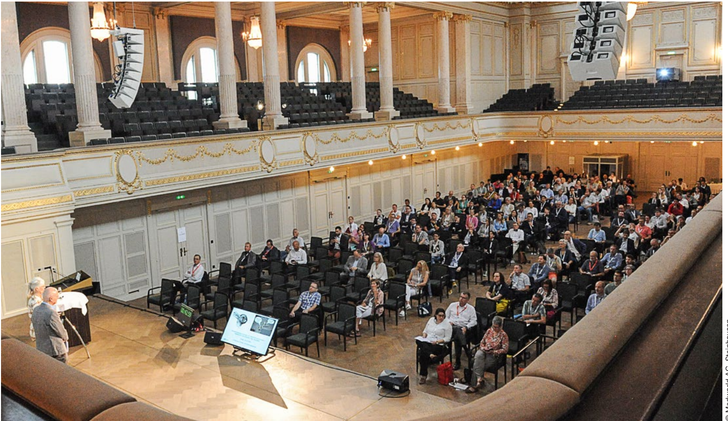
Le 10 e symposium MedEd a eu lieu le 13 septembre 2023 à Berne.