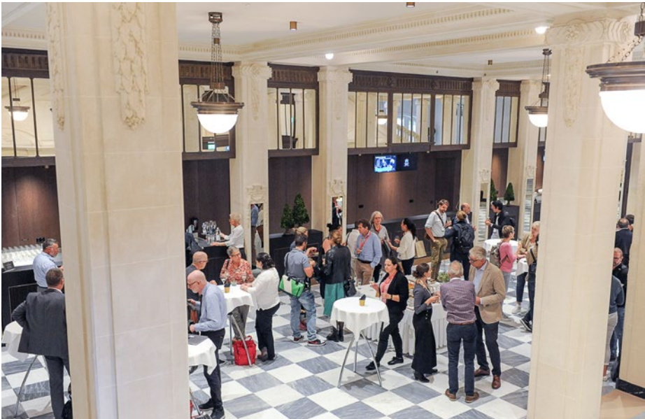
Échange et mise en réseau: l'idée initiale est largement vécue.

une équipe dédiée et disposent de leur propre site internet. Un groupe de travail composé de représentantes et de représentants de la Commission interfacultaire médicale suisse (CIMS) et de l'ISFM a commencé ses travaux visant à rendre plus visibles les médecins spécialement formés dans le domaine de l'éducation médicale en leur attribuant une sorte de label de qualité. Par ailleurs, l'ISFM collabore avec de nouveaux hôpitaux pilotes qui souhaitent démarrer ou poursuivre à ses côtés le changement culturel nécessaire à une formation postgraduée de haut niveau. Enfin, la série d'articles sur la formation postgraduée basée sur les compétences a été poursuivie dans le Bulletin des médecins suisses.